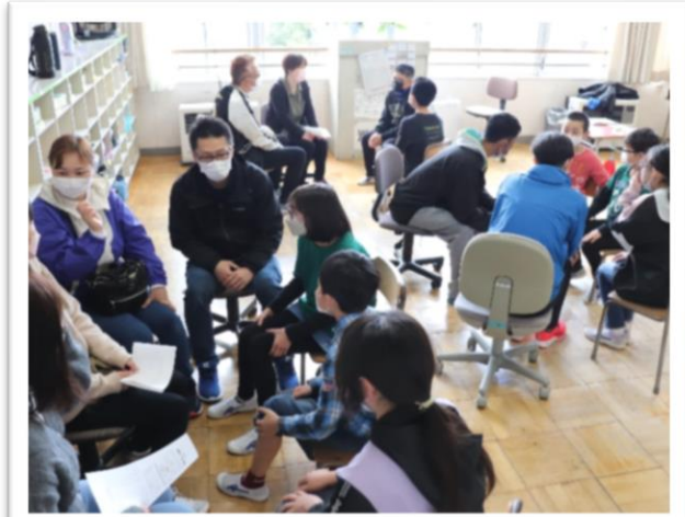
想像力を働かせてお話をつなぐ6年生の親子＝4月16日 授業参観