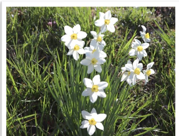
子どもたちの登下校をそっと見守ったスイセン (花言葉：神秘) = 4月15日撮影