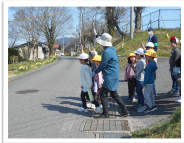
手を高くあげて道路を横断する低学年児童＝4月11日 交通安全教室