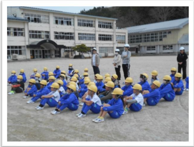
ヘルメットをかぶって無事避難完了＝4月16日 避難訓練