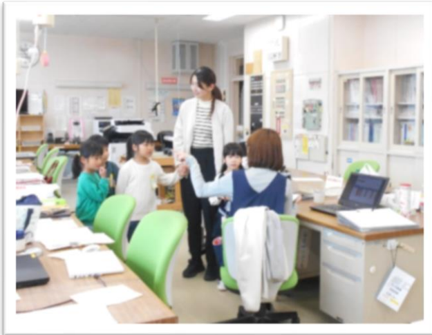
入学式の翌日職員室を訪れて養護教諭と話す1年生＝4月9日 学校たんけん