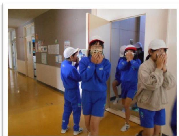
万一のときも落ち着いて避難行動ができる ために=4月25日 防火扉訓練