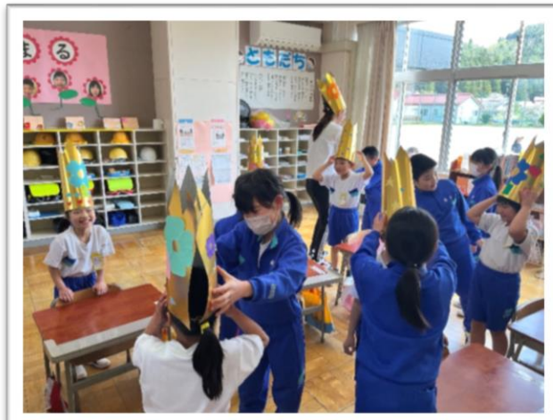
4年生からプレゼントをもらい大喜びの 1年生=4月19日 1年生を迎える会