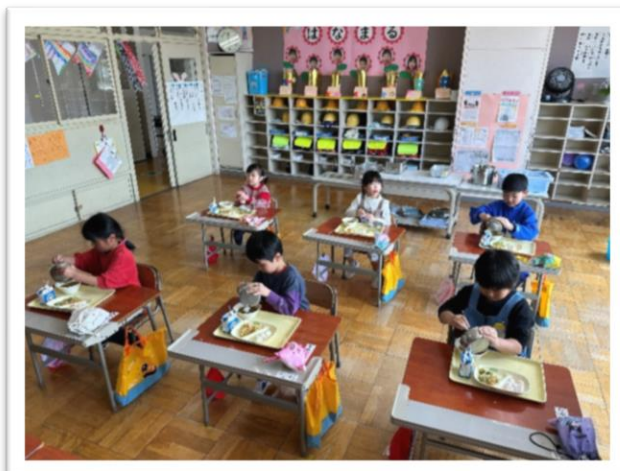
カレーにご飯を入れる「給食ルール」を学んだ 1年生=4月19日 カレー給食