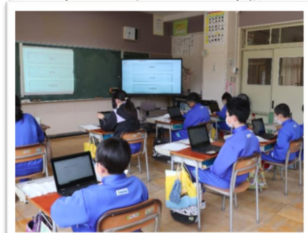
全国学調の質問紙はタブレット端末を使ってオンライン回答＝4月23日

【猿沢小学校ホームページ】 https://ichinoseki-sarusho.edumap.jp 更新準備中！