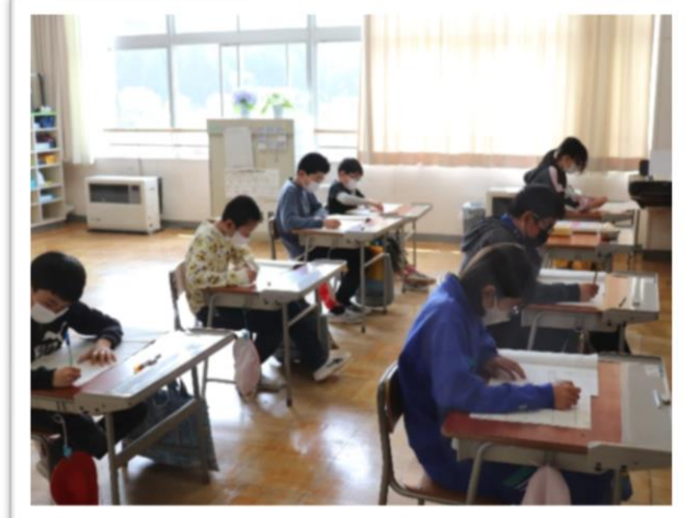
全国学力・学習状況調査（全国学調）に挑む6年生＝4月18日 6年教室