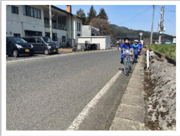
安全運転のため慎重にハンドルを操作する 4年生児童=4月11日 交通安全教室