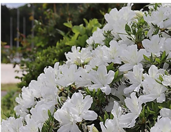
子どもたちの登下校を見守ったシロリュウキュウ (花言葉: 愛の喜び) = 5月9日撮影