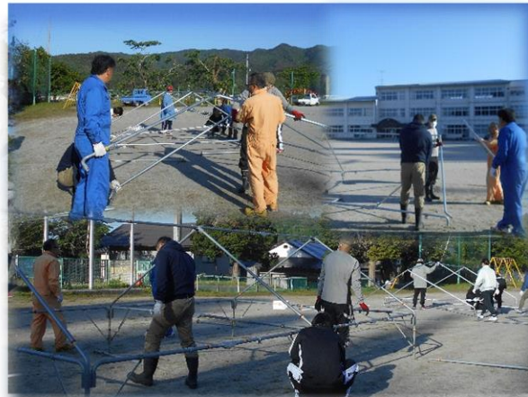
運動会用のテント設営にもご協力いただきました = 5月18日 環境整備作業