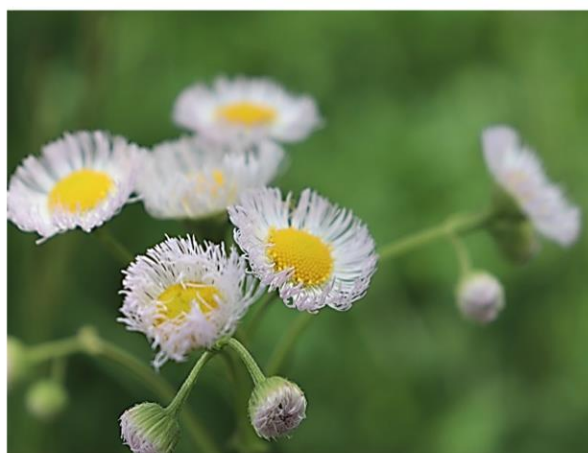
素朴な存在感が可愛らしいハルジオン (花言葉: 追想の愛) = 5月9日撮影