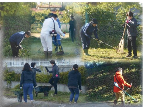
多くの皆さんのおかげにより校舎周辺を整備完了 = 5月18日 環境整備作業