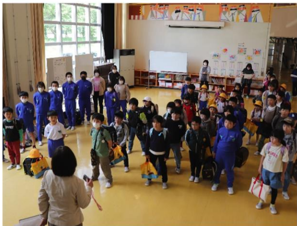
全校児童ホールに集合。兄弟関係で整列し待機中 = 5月8日 引き渡し訓練