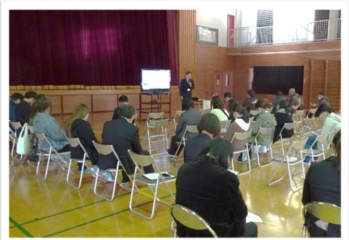
実際にスマホを使いながらネットの危険性を体感したPTA参加者=11月21日 PTA 講演会