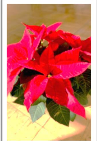
ポインセチア (花言葉：幸運を祈る) =11月29日撮影