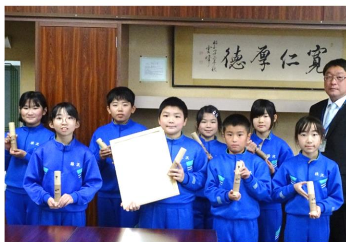
岩手県知事から「地球温暖化を防ごう隊」の取組の表彰を受けた第4学年児童=12月12日