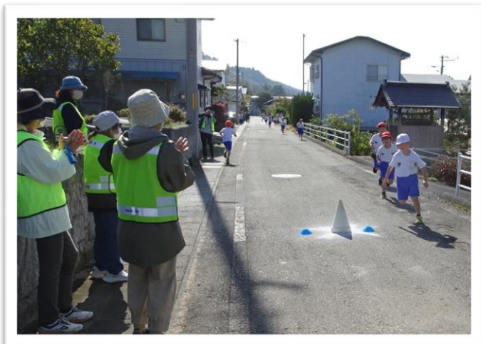
たくさんの応援を受け、ゴールを目指して懸命に走る低学年の子どもたち=10月30日 ロードレース