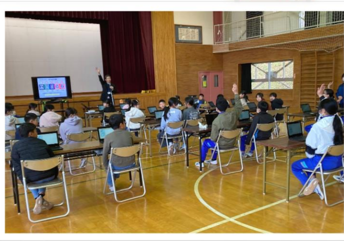
ゲームソフトに含まれる表現内容にふさわしい年齢区分を学ぶ高学年児童=11月12日 情報モラル学習